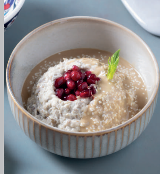
Mutabbal 225 ₺

Kırmızı biber, soğan, sarımsak, salatalık, biber salçası, zeytinyağı ve baharatlarla tatlandırılmış ezme.