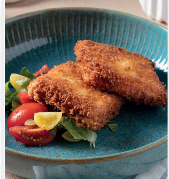
Pane Hellim Kızartması 620 ₺ Çıtır ekmek ile panelenmiş hellim peyniri

“Yemeğinize daha iyi hazırlayabilmemiz için lütfen bize diyet gereksinimlerinizi ve alerjilerinizi bildirin” Tüm fiyatlar Türk Lirası olarak belirtilmiş olup, KDV dahildir. %10 Servis ücreti dahil edilecektir.