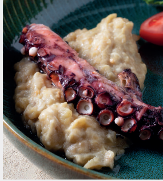
Beğendili Ahtapot Izgara 1.050 ₺ Patlıcan beğendi, maskolin ve ızgara ahtapot ile servis edilir.