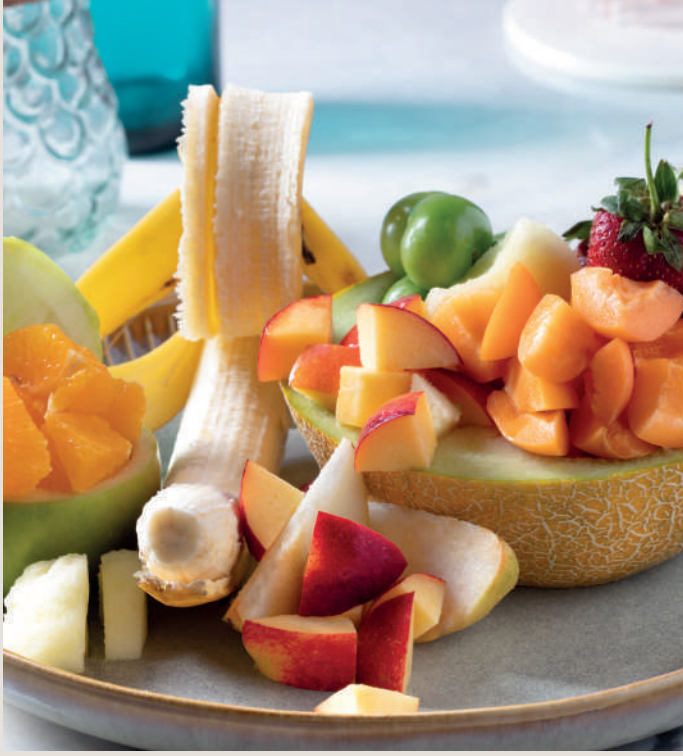
Meyve Tabağı 520 ₺ Mevsim Meyveleri