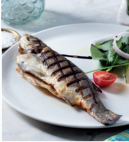
Izgara Levrek 930 ₺

Kömür ızgarada pişirilmiş mevsim yeşillikleri ile ızgara balık. (1 kg deniz levreği kullanılmıştır.)