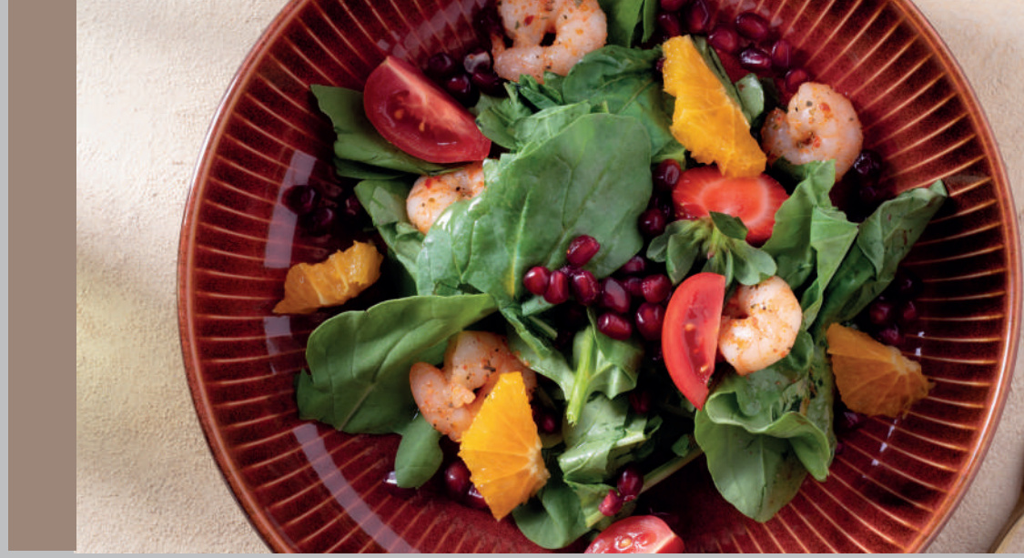
Nar Taneli Rokalı Karides Salatası 740 ₺

Tereyağında sotelenmiş karides, roka, vişne taneleri veya nar taneleri ile servis edilir