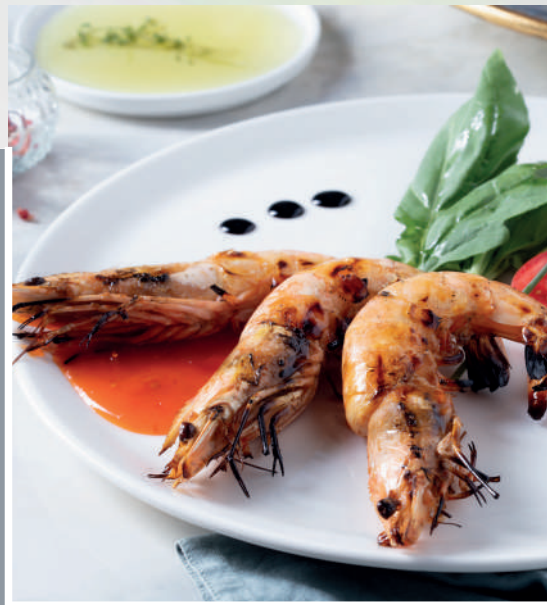
Izgarada Jumbo Karides 1.800 ₺

Kömür ızgarada pişirilmiş mevsim yeşillikleri ile ızgara balık.