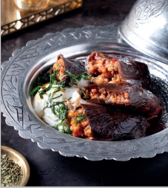
Kuru Patlıcan Dolması 460 ₺ İnce yağlı dana kıyması, biber salçası, biberiye ve çeşitli baharatlar ile hazırlanmış patlıcan dolması. Ilık yoğurt eşliğinde.