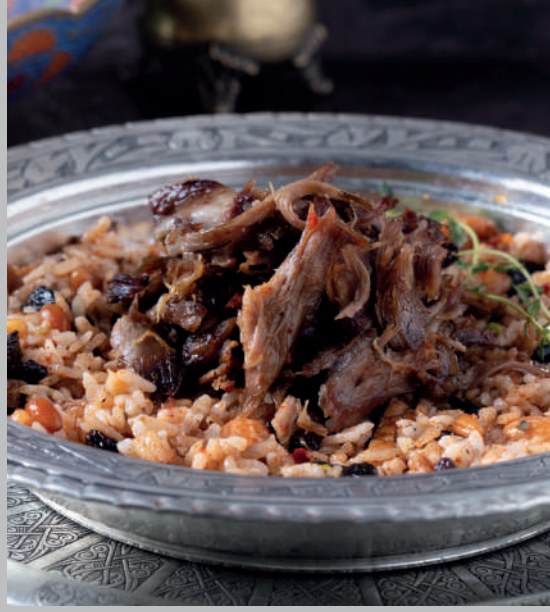
Kuzu Tandır 1.350 ₺

Taş fırında geleneksel yöntemle pişirilen baharatlı pilavlı kuzu eti.