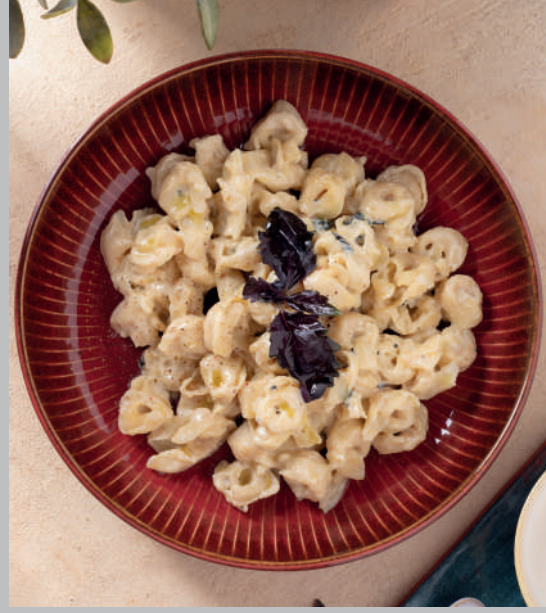
Reyhan Soslu Kremalı Tortellini 620 ₺