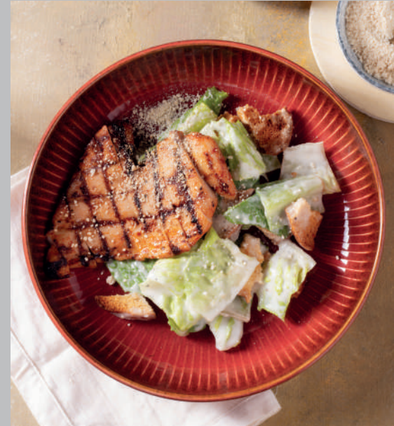
Tavuklu Sezar Salata 680 ₺

Domates, salatalık, biber, mor soğan, beyaz peynir