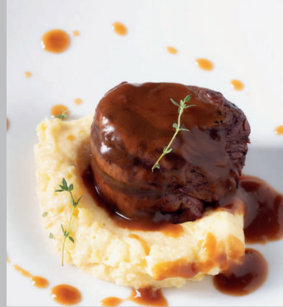
Demi Glace Soslu Fileminyon 1.450 ₺

Izgara köfte, domates soslu ekmek, ızgara sebze ve yoğurt ile servis edilir.