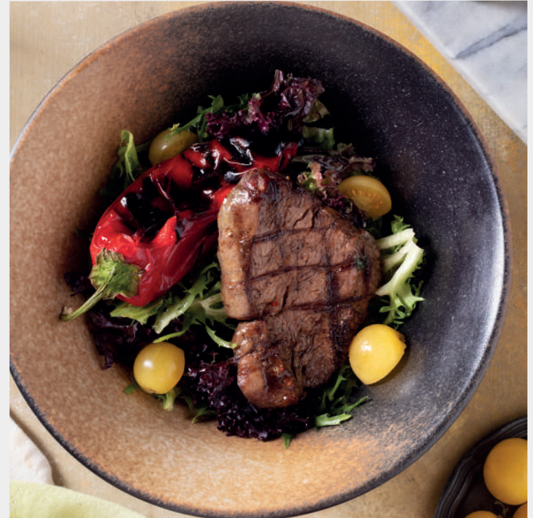
Köz Biberli Lokum Bonfile Salatası 850 ₺ Akdeniz yeşillikleri, közlenmiş kapyra biber, lokum bonfile, kruton ekmek, parmesan peyniri