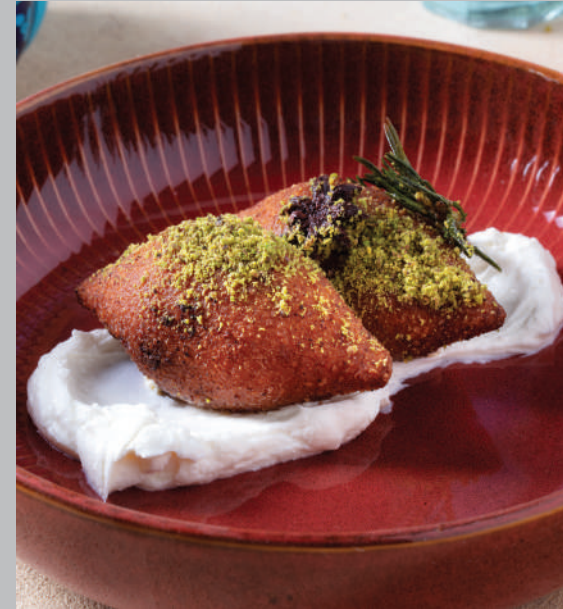
Fıstıklı İçli Köfte 420 ₺ Cevizli kıyma harcı ile doldurulmuş bulgur, fıstık ve süzme yoğurt ile servis edilir.

“Yemeğinize daha iyi hazırlayabilmemiz için lütfen bize diyet gereksinimlerinizi ve alerjilerinizi bildirin” Tüm fiyatlar Türk Lirası olarak belirtilmiş olup, KDV dahildir. %10 Servis ücreti dahil edilecektir.