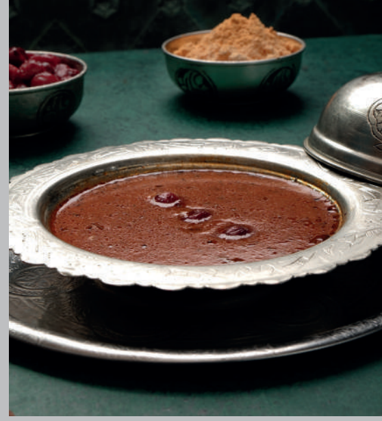
Vişneli Tarhana Çorbası 320 ₺

Mercimek çorbası, yanına bir dilim limon, üzerine tereyağlı hafif acı sos ile servis edilir.