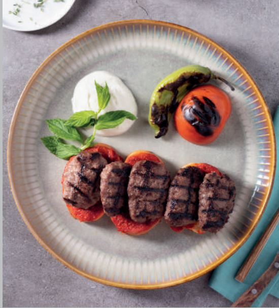
Islak Köfte 780 ₺

Izgara köfte, domates soslu ekmek, ızgara sebze ve yoğurt ile servis edilir.