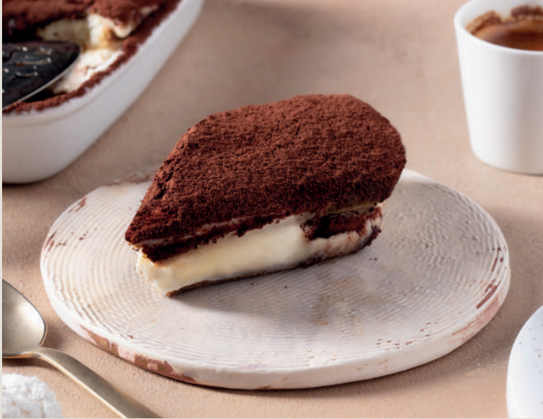
Damla Sakızlı Tiramisu 380 ₺ Damla sakızlı, Türk kahvesi aromalı tatlı.

1539 yılında Kanuni Sultan Süleymanın oğulları Cibangir ve Beyazıt'ın sünnet düğününde yemek listesinde yer almış özel bir tatlıdır.