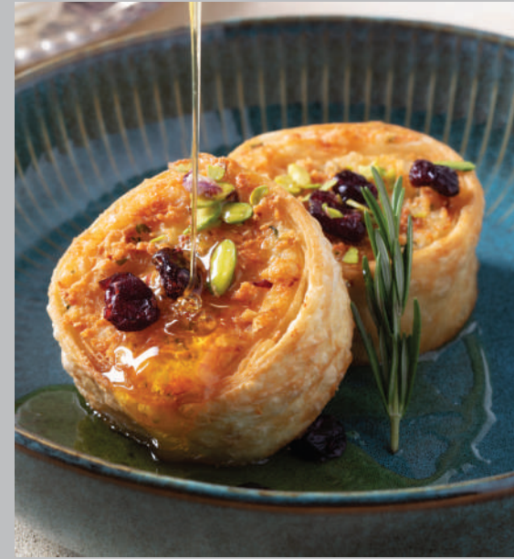
Lokal Peyirli Gemici Böreği 625 ₺ Karışık Türk peynirleri, bal, kuş üzümü.