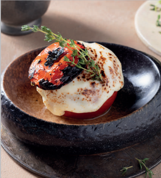
Karidesli Domates Dolması 520 ₺ Karidesle doldurulmuş fırınlanmış domates, kaşar peyniri.