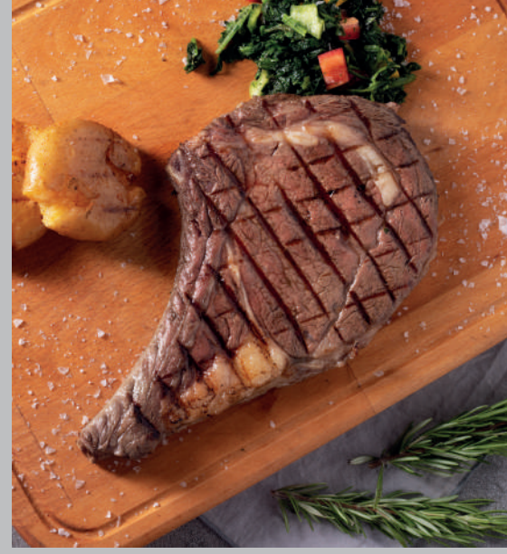
Dana Pirzola 1.450 ₺

Taş fırında geleneksel yöntemle pişirilen baharatlı pilavlı kuzu eti.