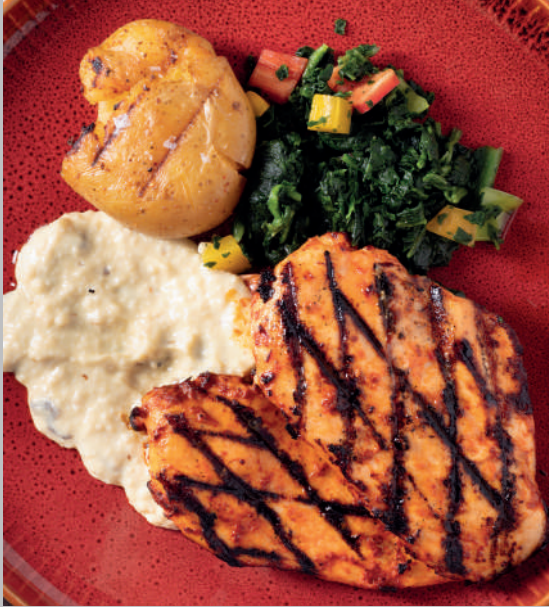
Tavuk Göğüs Izgara 800 ₺

Kremalı ıspanak sote ve fırınlanmış patates ile servis edilir.