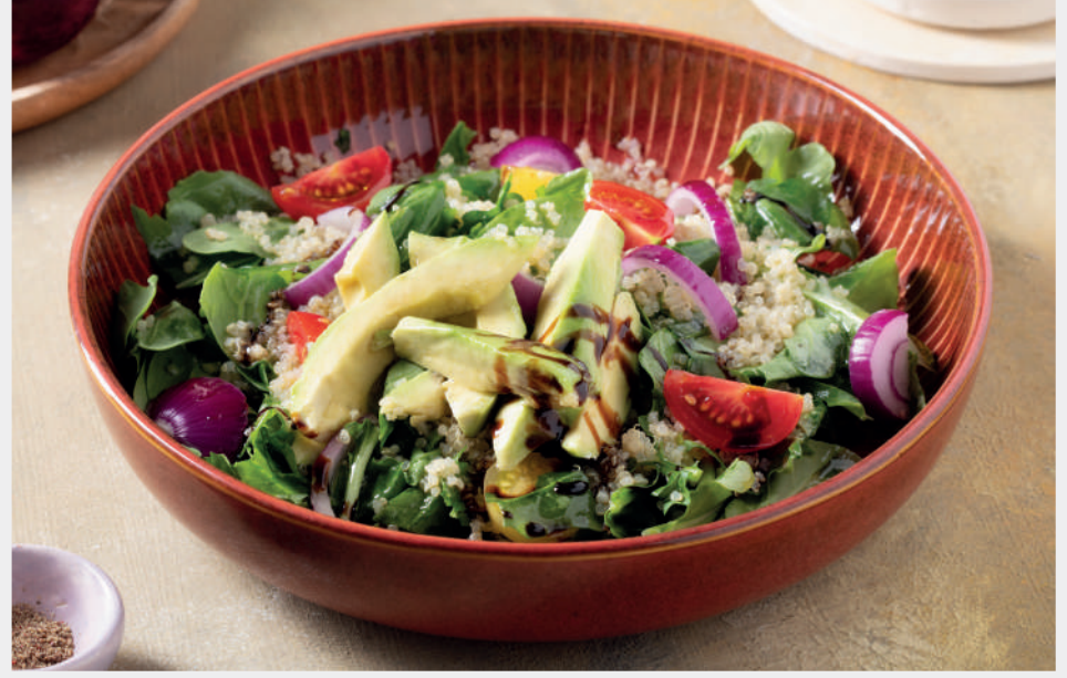
Avokadolu Kinoa Salatası 680 ₺ Roka, kinoa, avokado, zeytinyağı, balzamik sirkesi