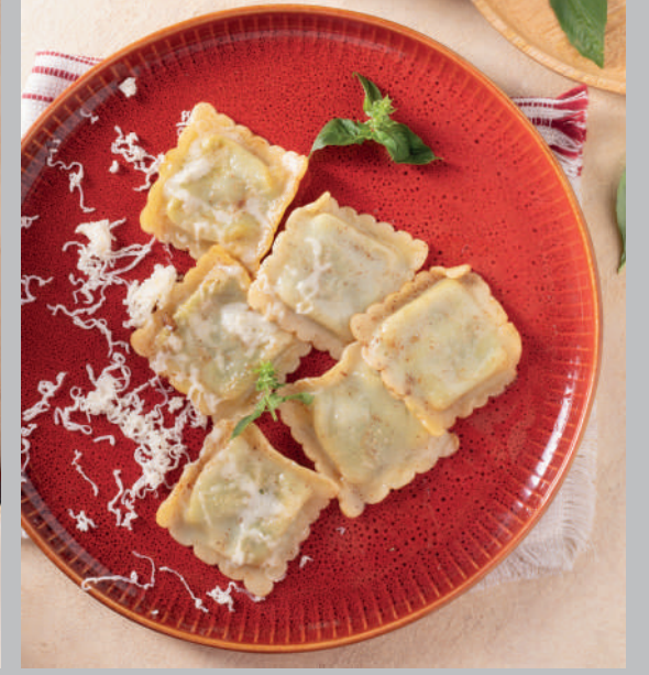
Ispanaklı Beyaz Peyirli Ravioli 520 ₺