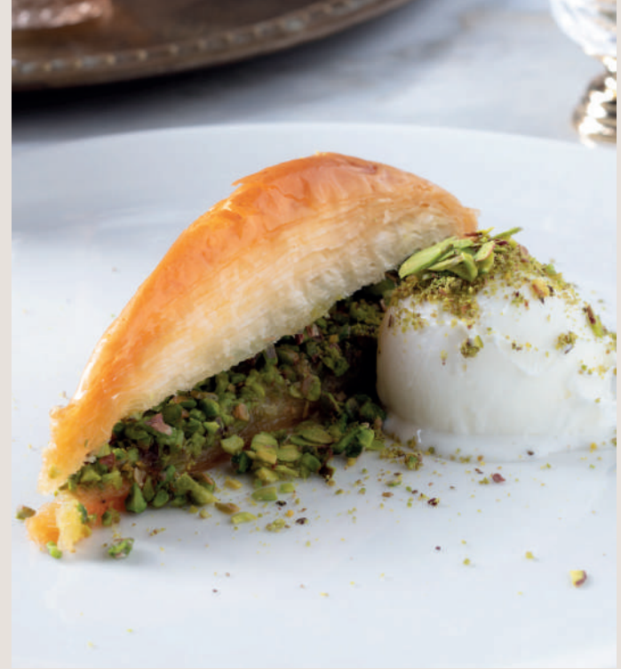
Baklava 520 ₺ Mermer tezgâhta açılmış ince yufkaların arasında kat kat lezzetler serpilir. Bol tereyağı ile pişirilen baklavaya hazırlanan şerbet dökülür. Keçi sütünden dondurma ile sunulur.