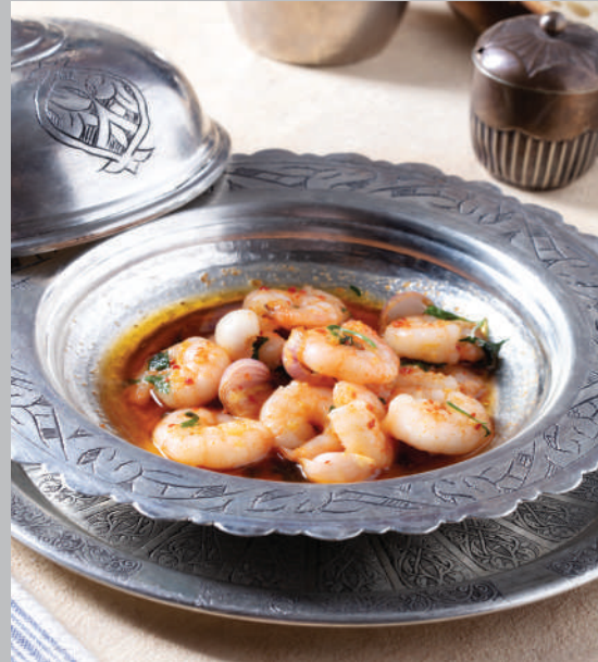
Karides Güveç 940 ₺ Karides, tereyağı, sarımsak, arpacık soğan, renkli biber.