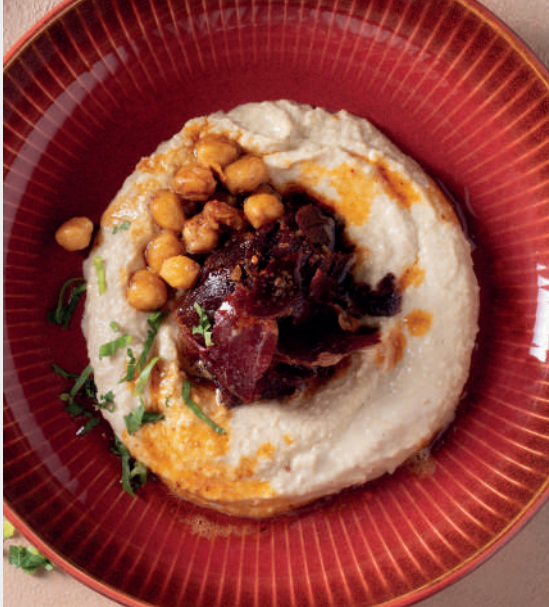
Tereyağlı Pastırmalı Sıcak Humus 620 ₺ Nohut, tahin, tereyağı, pastırma