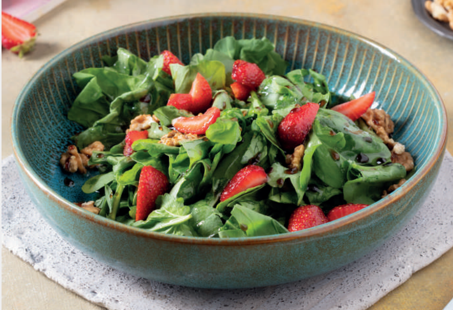
Cevizli Nar Taneli Roka Salatası 510 ₺ Mevsimine göre nar veya çilek ile servis edilir