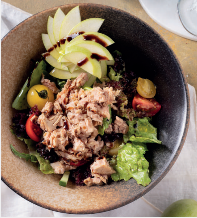
Yeşil Elmalı Ton Balıklı Salata 720 ₺ Akdeniz yeşillikleri, yeşil elma, ton balığı