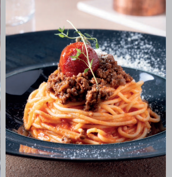
Spagetti Bolonez 600 ₺ İnce kıyma et, fesleğen ve parmesan peynirli makarna

“Yemeğinize daha iyi hazırlayabilmemiz için lütfen bize diyet gereksinimlerinizi ve alerjilerinizi bildirin” Tüm fiyatlar Türk Lirası olarak belirtilmiş olup, KDV dahildir. %10 Servis ücreti dahil edilecektir.