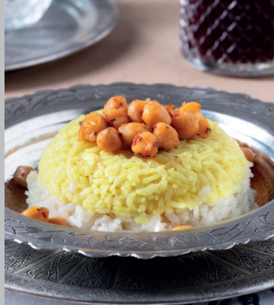
Dane-i Sarı 390 ₺ Nohutlu ve safranlı pilav