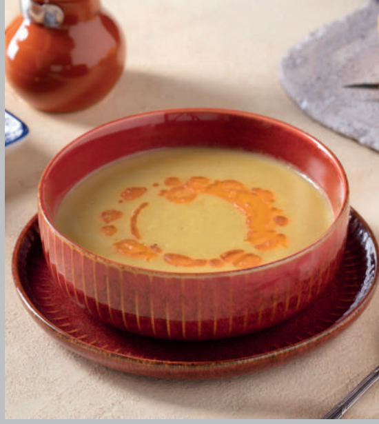
Mercimek Çorbası 270 ₺

Mercimek çorbası, yanına bir dilim limon, üzerine tereyağlı hafif acı sos ile servis edilir.