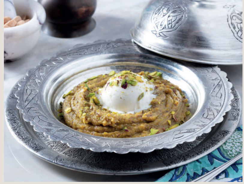
Levzine 500 ₺ Toz badem, tereyağı ve bal ile yapılan badem unu helvasıdır.

1539 yılında Kanuni Sultan Süleymanın oğulları Cibangir ve Beyazıt'ın sünnet düğününde yemek listesinde yer almış özel bir tatlıdır.