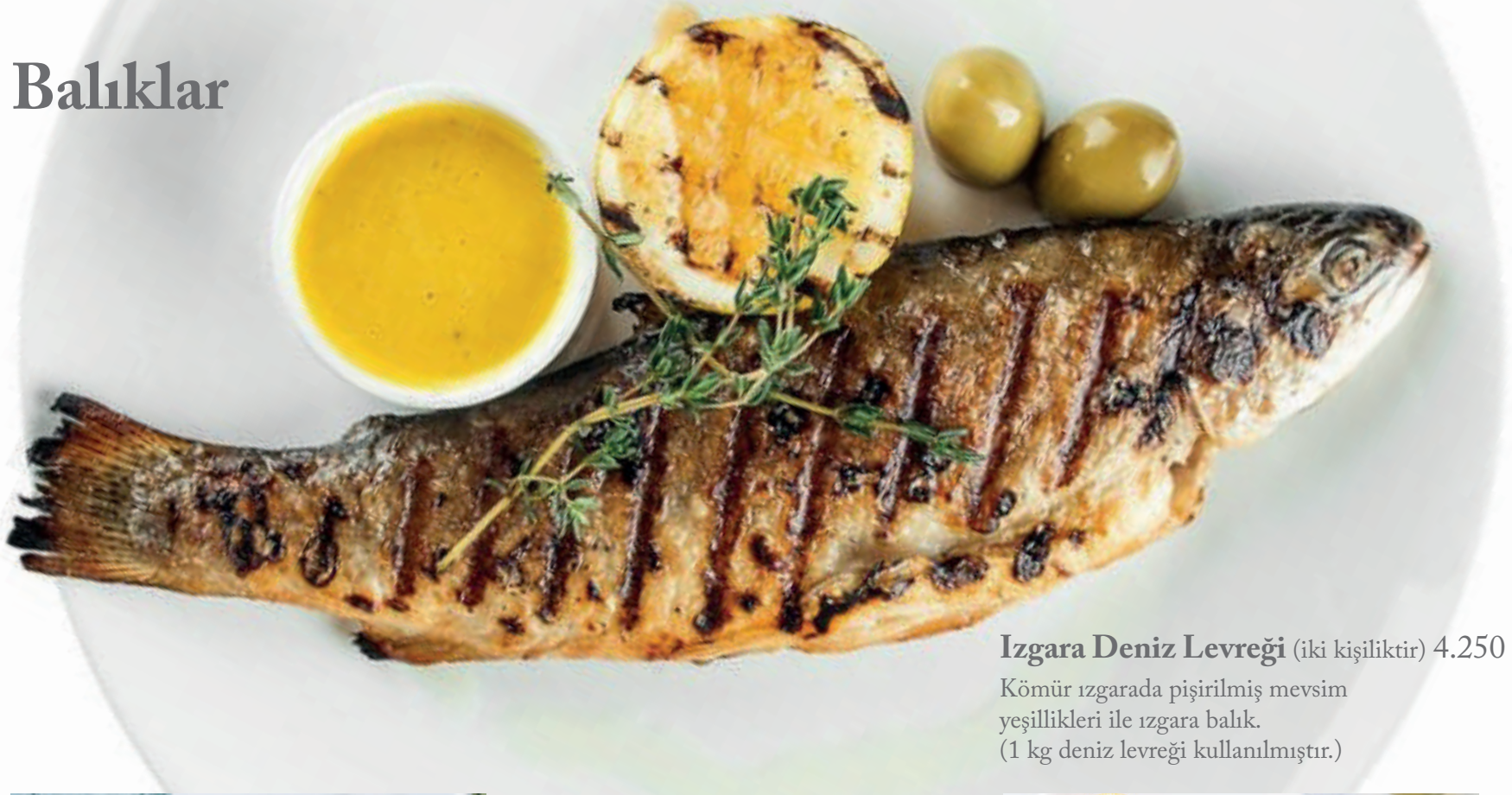
Izgara Deniz Levreği (iki kişiliktir) 4.250 ₺

Kömür ızgarada pişirilmiş mevsim yeşillikleri ile ızgara balık. (1 kg deniz levreği kullanılmıştır.)