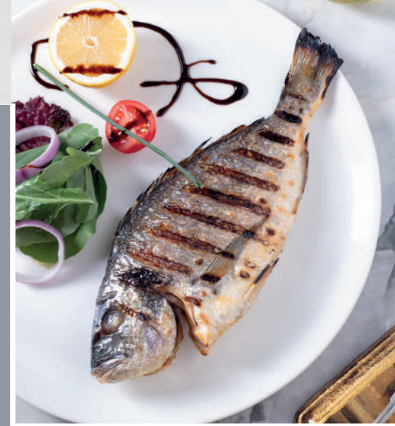
Izgara Çupra 930 ₺

Kömür ızgarada pişirilmiş mevsim yeşillikleri ile ızgara balık.