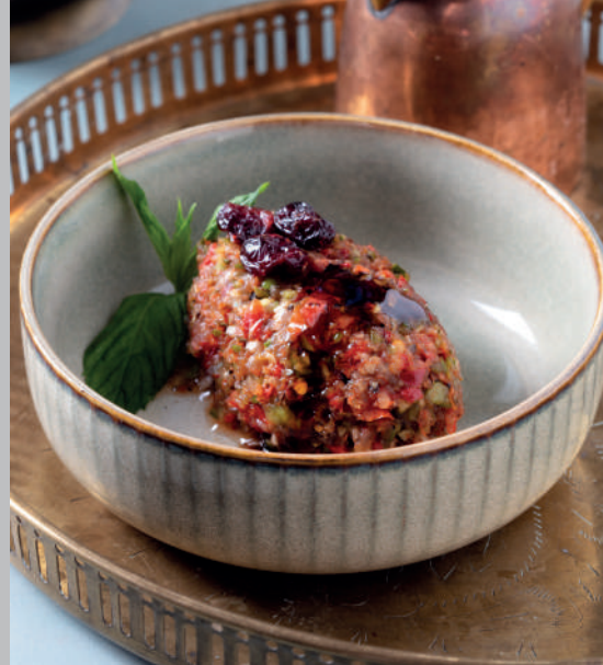
Acılı Ezme 220 ₺

Közlenmiş patlıcan, limon suyu, sarımsak.