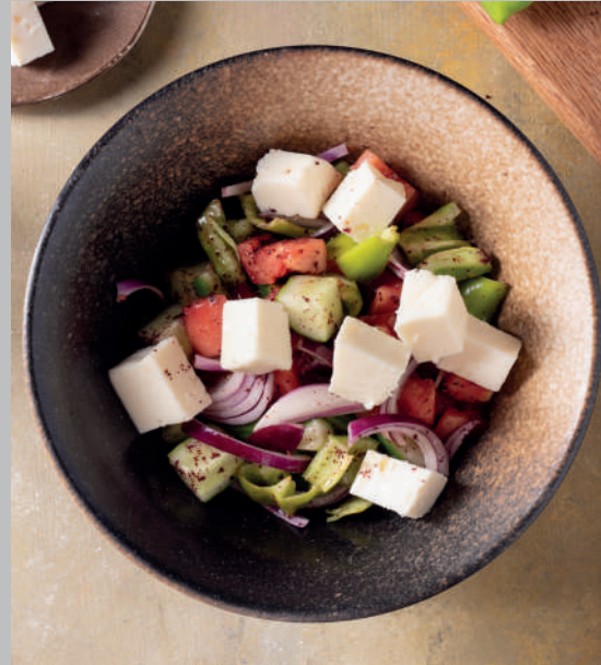
Greek Salata 590 ₺

Halka keçi peyniri, akdeniz yeşillikleri, balzamik sirkesi