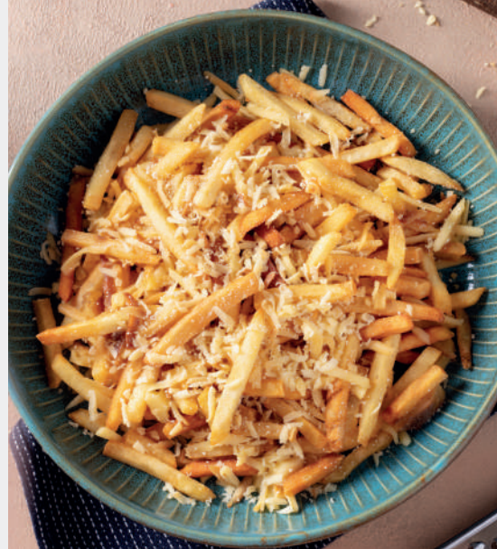
İsli Çerkez ve Parmesan rendeli Patates Kızartması 400 ₺