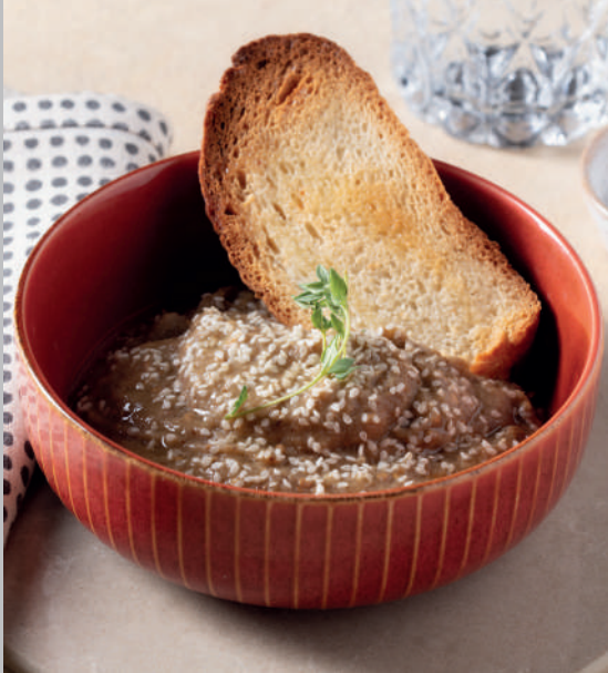
Babaganuş (yoğurtsuz) 220 ₺

Közlenmiş patlıcan, limon suyu, sarımsak.