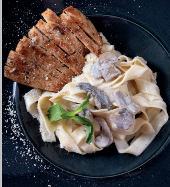
Tavuklu Fettucini 720 ₺ Mantar, sebze ve kremalı makarna