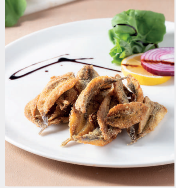
Çıtır Hamsi (sezonluktur) 640 ₺ Panelenip kızartılmış hamsi, roka ve soğan ile servis edilir.