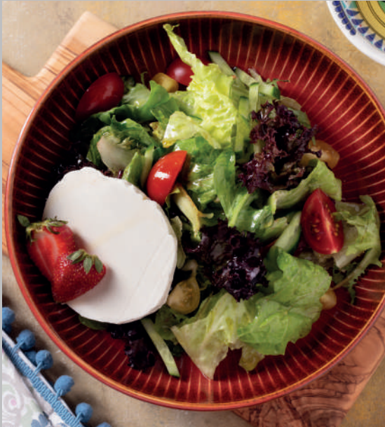
Keçi Peynirli Salata 520 ₺

Halka keçi peyniri, akdeniz yeşillikleri, balzamik sirkesi