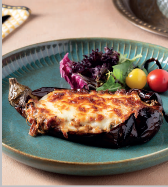
Tulum Peyirli Köz Patlıcan 480 ₺ Közlenmiş patlıcan, tulum peynirli iç dolgu, kaşar peyniri.